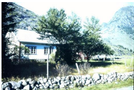
Lærerboligen i Ørdsdalen skoleåret 1969/70.