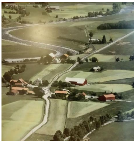
Vassbø ca. 1972.