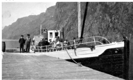
Den nye båten, Ørdsdølen I, ved kai på Vassbø i 1920-åra.