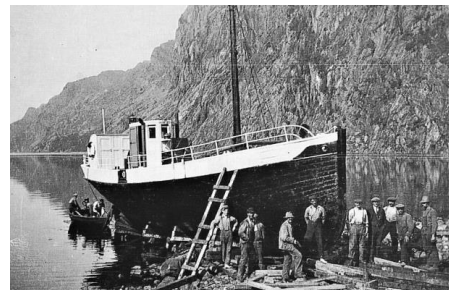
«Ørdsdølen» på slipp nord for kaia på Vassbø. Det er folk fra dalen som driv med vedlikehold, trulig i 1942 eller 1945.