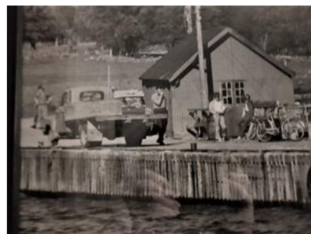
Vassbøkaia med Guttom Hovland sin lastebil ca. 1970..