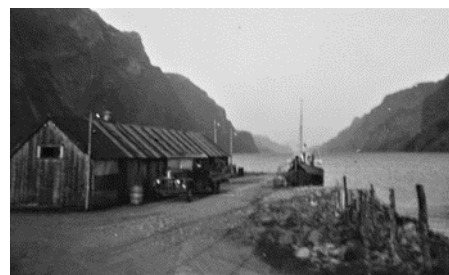
Kaia på Vassbø med lagerhuset 1959.