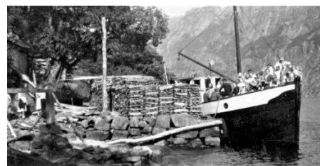
Ørdsdølen I ligger til kai i Dyrskog med mye folk om bord. På kaia ligg det oppstaplet fyringsved klar for å fraktes ut vatnet.