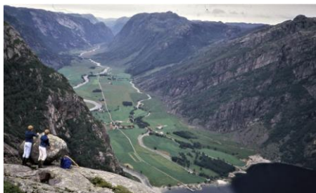
Oversikt over Ørdsdalen med vegen fra kaia og innover dalen.